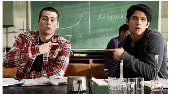
Teen Wolf saison 2

Mais même si le personnage secondaire est le ou la meilleur(e) ami(e) du personnage principal, ils ne sont pas complètement similaires et c'est cela qui leur permet une relation plus intense. Si le personnage principal est plutôt réservé et rentre dedans comme Scott dans « Teen Wolf », son meilleur ami Stiles est blagueur et détendu, ce qui fait d'eux un duo de choc.